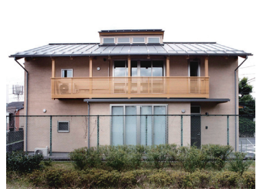
「き」組「200年住宅」江原の家 長期優良住宅先導的モデル事業採択