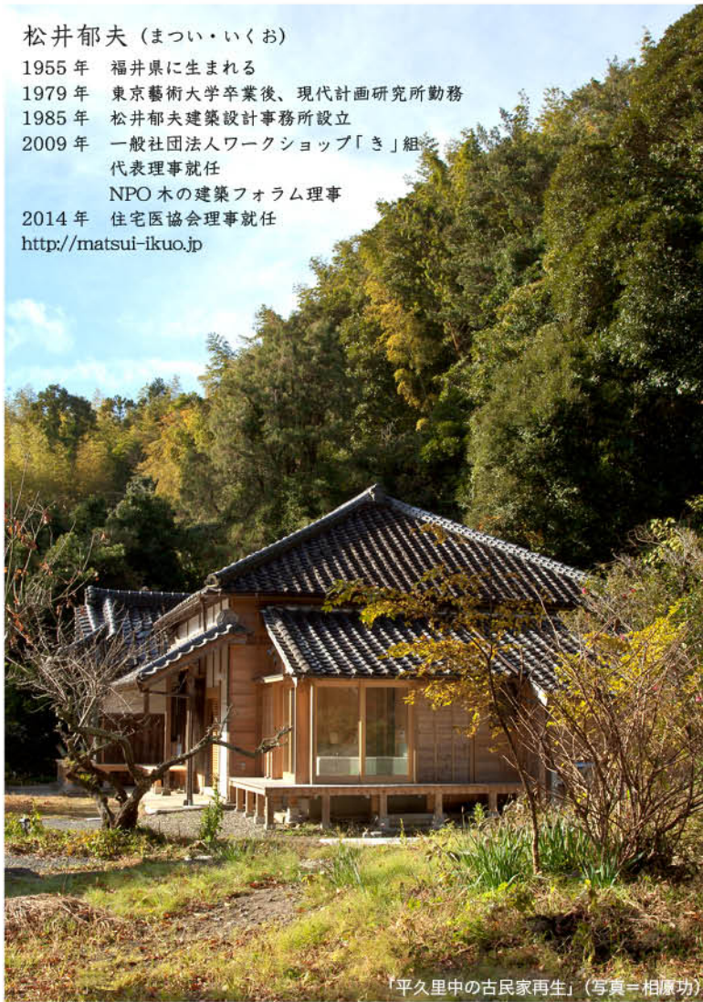
「平久里中の古民家再生」

1955年 福井県に生まれる 1979年 東京藝術大学卒業後、現代計画研究所勤務 1985年 松井郁夫建築設計事務所設立 2009年 一般社団法人ワークショップ「き」組 代表理事就任 NPO木の建築フォーラム理事 2014年 住宅医協会理事就任 http://matsui-ikuo.jp